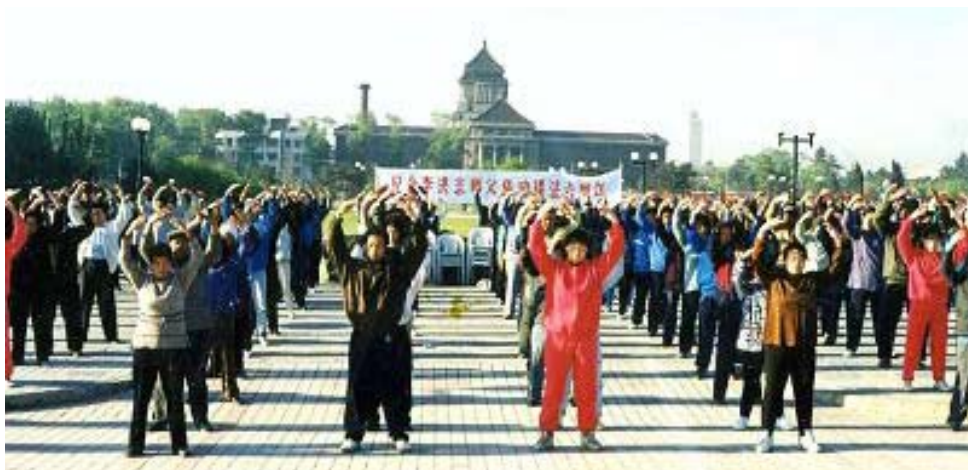
图：一九九八年五月，长春法轮功学员集体炼功。