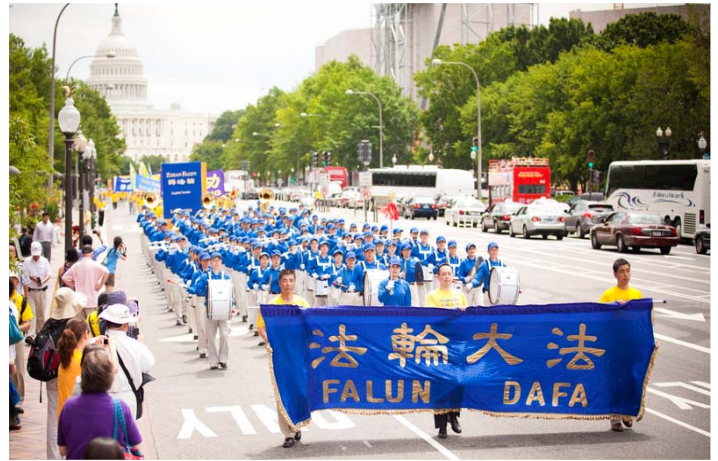
法轮功学员两千多人华府反迫害大游行。图为走在游行队伍最前面的天国乐团。

然而，中共的邪恶政权，面对一群善良的、手无寸铁的好人，却疯狂地大打出手。面对邪恶中共的迫害，十二年来，他们没有怨恨、没有斗争，也没有被吓倒，依然是那样的祥和慈善。不管是老人孩子、还是风华正茂的年轻人，他们眼神流露出的是殷切的希望和善待众生的慈悲。我看到一个老人坚毅慈祥的目光，看到一位壮年男子流露出殷切的希望和渴望众生被救度的眼神，他们手举着“世界需要真善忍”的标语，这是无声