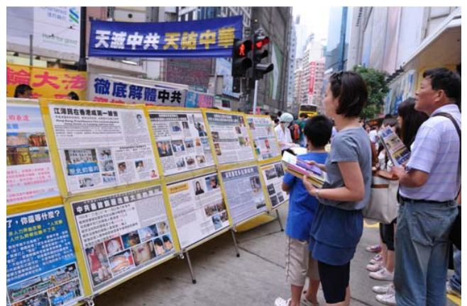
图：在香港维多利亚公园附近的真相展板，许多大陆游客手拿着《九评共产党》书、法轮功真相资料驻足认真观看真相展板上的法轮功真相。