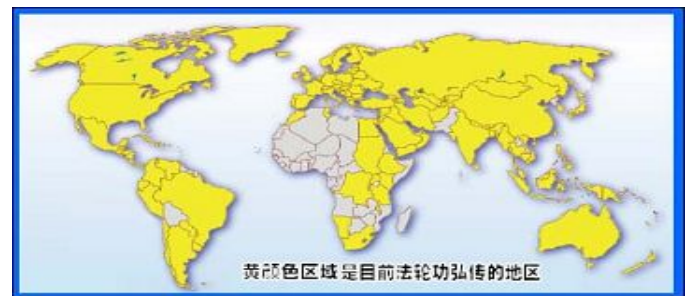
图：黄颜色区域是目前法轮功弘传的地区

数日益增多，开始利用整部国家机器诬蔑造谣、残酷迫害法轮功。十二年来法轮功学员不断运用各种渠道向世人讲清真相，已使广大人群从谎言诬陷中逐渐觉醒。相较于神州大地发生的严重迫害，法轮大法已弘传世界一百多个国家，使全球一亿多人身心受益，持续得到各界有识之士的理解和珍视。特别是北美、欧洲、亚洲、澳洲等地的各级政府、议会、非政府组织等民间团体，都高度推崇法轮功在提升道德、净化人心与强身健体、福国民民方面的卓越成果。