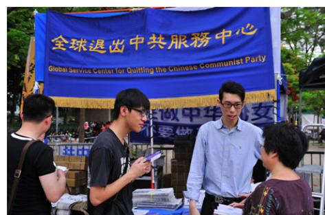
图：在香港维多利亚公园的退党服务中心，正在听法轮功真相的市民。