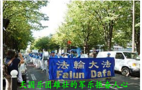
天国乐团雄壮的军乐振奋人心