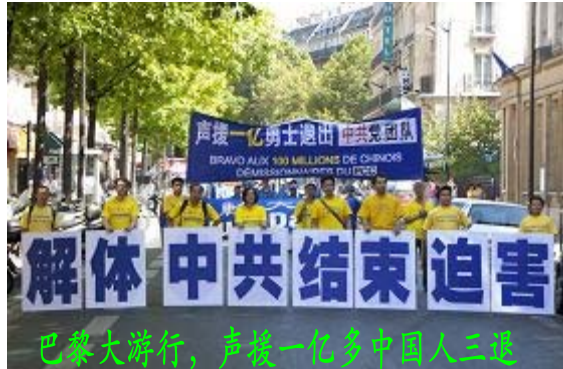
巴黎大游行，声援一亿多中国人三退

自二零零四年《九评共产党》传出以来，退出中共党、团、队的大潮席卷中国大陆。截至二零一一年八月七日，在大纪元退党网站上公开声明“三退”的人数超过一亿人。