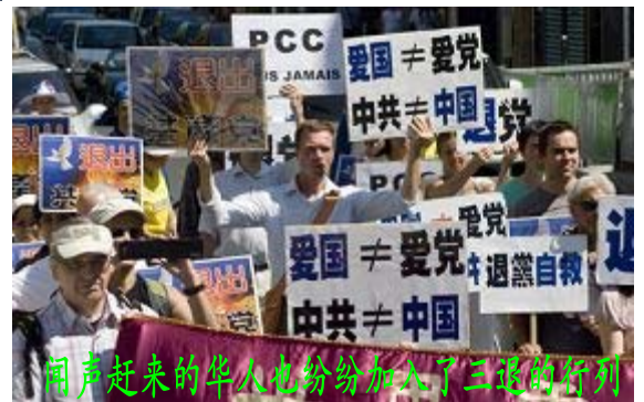
闻声赶来的华人也纷纷加入了三退的行列