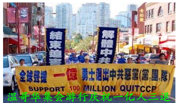
温哥华集会游行庆祝一亿人三退

【明慧网二零一一年八月二十三日】（明慧记者王枚温哥华报道）二零一一年八月二十日下午，温哥华退党服务中心在市中心艺术馆前举办了庆祝一亿中国人三退（退党、退团、退队）集会活动，温哥华法轮功学员到场声援。集会后举行了游行，活动中传递的一亿人三退的信息引起了人们的关注。