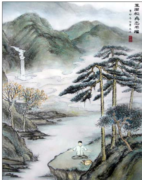
水墨山水画: 玉洁松贞志不摧