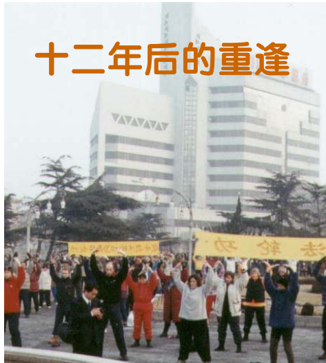
一九九九年一月二日，美国、瑞士、瑞典、芬兰等国大法弟子与大连大法弟子在中国大连集体炼功的场景。

一名来自丹麦的学员。她谈起这段经历激动地说：“那时我刚刚学法轮功，就觉得法轮功和其它气功不一样，所阐述的都是让人怎么成为一个好人的道理，道理简单明了，人生中的很多疑问都在书中找到了答案。炼功更是让我感到身心放松。去中国到北京和大连交流那是我第一次，非常难忘。记得到大连的时候，那里的学员非常热情，一些年纪大的大连学员居然用英文背诵《论语》（《转法轮》一书开篇的短文），这让西方学员感到非常亲切，同时也让我这个中国人感到非常惊讶，那么大岁数，居然在背诵，用的还是英语。”