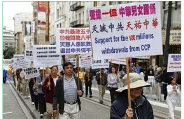
游行队伍经过市中心，庆祝一亿中国人三退