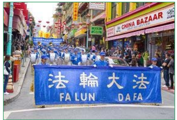
天国乐团雄壮的军乐振奋人心