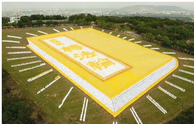
二零零九年十一月二十一日，台湾六千名法轮功学员将指导修炼的《转法轮》排成金光灿烂的立体书。

老人就从头开始背，警察认真地看。一会，他说：“您别背了，您背得一个字都不错，我服了，我信了。”老人说，“你别着急，我还没背完