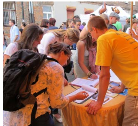
图：波兰民众纷纷签名反对中共迫害

越来越多了解真相的波兰人来到征签台排队签名，表达他们对中共邪恶行为的愤慨和反对。一位姑娘看到中国大陆法轮功学员遭受残酷迫害的照片，无法忍受，站在展板前失声痛哭。很多人都在询问“我还能帮助你