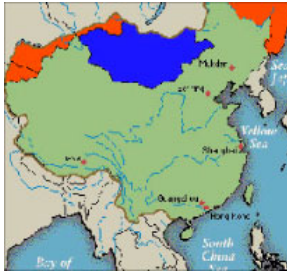
①②橙色部份为江泽民出卖的国土范围

1999 年 12 月 9 日和 10 日，江泽民在北京与来访的俄罗斯总统叶利钦签定了《中华人民共和国政府和俄罗斯联邦政府关于中俄国界线东西两段的叙述议定书》。《议定书》中，江泽民出卖了 100 多万平方公里的宝贵领土，相当于东北三省面积的总和，也相当于几十个台湾。