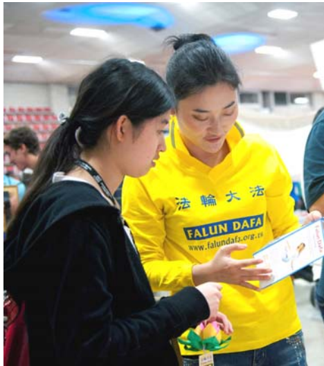
图：法轮大法俱乐部成员在迎新活动中讲真相