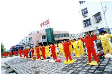
图：一九九九年四月，逾千人在武汉常青花园街头炼功。

一九九五年的一个冬天的夜晚，下了一晚上的大雪，清晨，我们踏着厚厚的积雪来到汉口中山公园炼功。突然，我听见有两个人大喊：“哎呀，法轮功这么整齐，老人、青年、小孩，人人脸上是慈祥的微笑，没有一丝寒冷的样子，静静地打坐这么长时间，真是不可思议，平时公园里五花八门的气功门派，今天没有一个人了，你们法轮功真是一道独特的风景线，太美了，能允许我拍照吗？”他们非常高兴地拍下了一组珍贵的镜头，起名为“一道独特的风景线”。