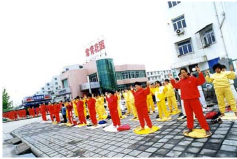
图：一九九九年四月，逾千人在武汉常青花园街头炼功。

一九九五年的一个冬天的夜晚，下了一晚上的大雪，清晨，我们踏着厚厚的积雪来到汉口中山公园炼功。突然，我听见有两个人大喊：“哎呀，法轮功这么整齐，老人、青年、小孩，人人脸上是慈祥的微笑，没有一丝寒冷的样子，静静地打坐这么长时间，真是不可思议，平时公园里五花八门的气功门派，今天没有一个人了，你们法轮功真是一道独特的风景线，太美了，能允许我拍照吗？”他们非常高兴地拍下了一组珍贵的镜头，起名为“一道独特的风景线”。