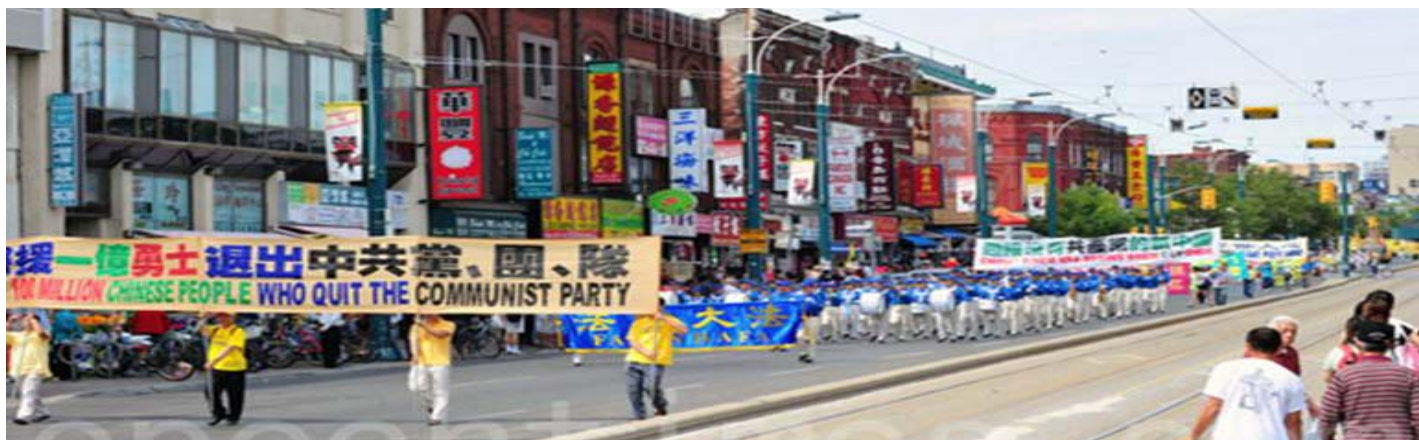
图：八月十三日，加拿大多伦多各界声援一亿中国人退出中共及其附属组织。

【明慧网】2004年，大纪元时报发表社论《九评共产党》，给为祸人间一个多世纪的国际共产主义运动，特别是中国共产党盖棺论定。《九评共产党》揭示了共产党的真相，告诉了人们共产党是什么，揭示了其本质其实就是一个为害人类的邪教，把共产党的所言所行都说了个清楚。