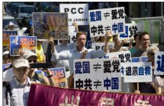
巴黎大游行，声援一亿多中国人三退