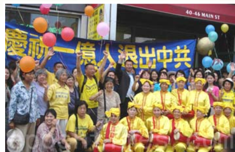
全球退党服务中心纽约总部

当初人们入党或者加入其附属组织共青团、少先队时，发誓要把生命交给这个邪灵，实际上就成了中共魔教的一员。当人们明白真相加入“退党大潮”时，就是帮助人们摆脱中共，以免成为中共被淘汰