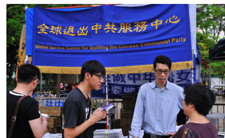
香港维多利亚公园退党服务中心