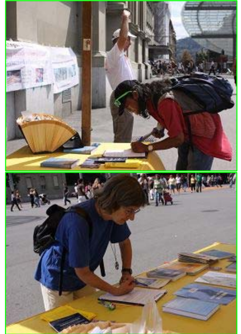
■瑞士首都伯尔尼火车站广场上，路人签名声援法轮功反迫害

当天还有十五名来自中国大陆的游客了解真相后，声明退出了中共的党团组织。◇（文/瑞士法轮功学员）