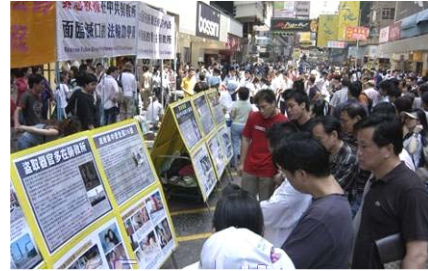
大陆游客在香港看法轮功真相展板

中共耗资几十亿建造世界上最大的网络防火墙,设置网络敏感词过滤,主要目的之一就是不让人们访问海外讲述法轮功真相的网站。比如,中共曾经想推广的“绿坝”软件,其主要目的是过滤关于法轮功的词汇。