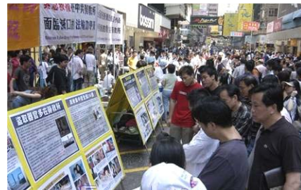
大陆游客在香港看法轮功真相展板

中共耗资几十亿建造世界上最大的网络防火墙,设置网络敏感词过滤,主要目的之一就是不让人们访问海外讲述法轮功真相的网站。比如,中共曾经想推广的“绿坝”软件,其主要目的是过滤关于法轮功的词汇。