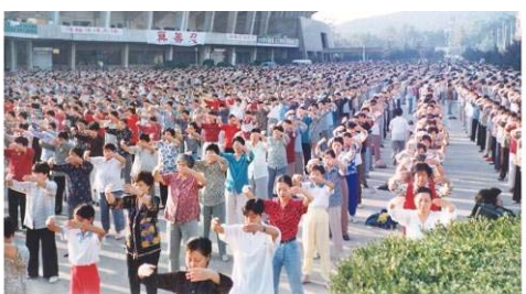
1998年近万名济南法轮功学员在山东体育中心广场炼功。

我每天除了打针就是吃药，身体承受着病痛的折磨，真是痛不欲生！为了治好我的病，丈夫除了整天拼命挣钱外，就是带我到处求医问药，几乎跑遍了省城的各大医院，最后，碰到了那个好心的老专家教授，他才对我们说了文章开篇的那番肺腑之