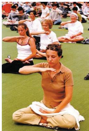
巴黎法轮功学员集体炼功