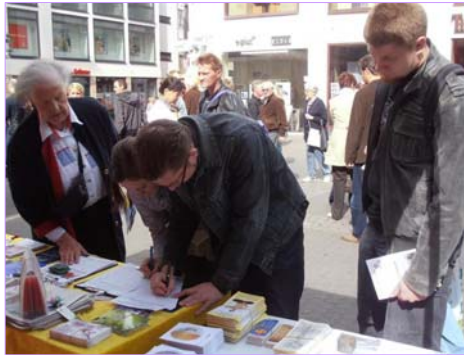
明白真相的人们纷纷签名支持反迫害

一对衣着考究的中年夫妇看过有关活摘器官的真相传单，停下来和学员交谈。他们说，“这个（中共）政权简直太不可思议了。你们是做很