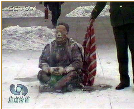
图：“自焚”是中共一手导演拍摄的煽动仇恨的假戏。

我们很幸运借助这条新闻了解了跨步电压触电的保命知识，但是下面这条新闻的主人公当时并不知道