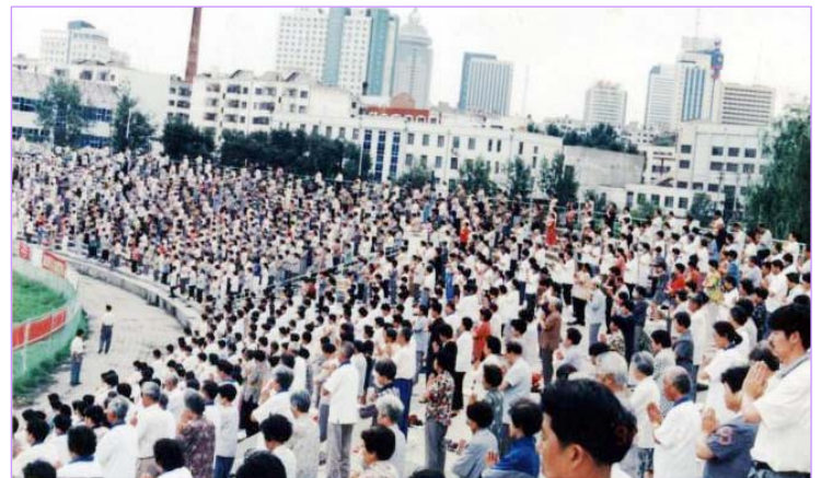
1999 年迫害前, 哈尔滨 3 万人在体育场晨炼法轮功功法

新华网为什么要造这样的谣言? 中共迫害法轮功已长达 12 年, 12 年来中共早已因迫害而声名狼藉, 而且它罪恶的本质也越来越被世人看清。此时用这么下流的手段抹黑法轮功, 不过就是想继续维持迫害, 并借此恐吓中国老百姓而已。中共一方面用一言堂的喉舌媒体炮制谎言, 诬陷教人向善的法轮功, 一方面封锁明慧网等法轮功的网站, 阻止大陆民众接触法轮功书籍, 足见其流氓本性。◇