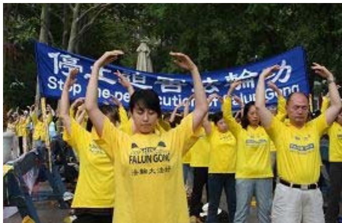
联合国峰会期间，纽约法轮功学员在联合国外集会呼吁制止长达十二年的迫害。（上图）