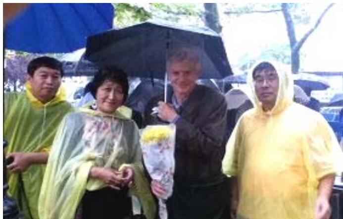
前来参加联合国峰会的加拿大前亚太司司长、前资深国会议员大卫-乔高，到法轮功学员的抗议地点，献给学员，并表示支持法轮功学员反迫害。（上图）

【明慧网二零一一年九月二十八日】二零一一年九月十九日至二十六日，纽约联合国总部召开第六十六届高级别会议，各国首脑云集。此间的每一天，纽约法轮功学员都在联合国前集会，揭露中共对法轮功学员的残酷迫害，呼吁国际社会关注中国大陆法轮功学员的人权状况，共同制止已经长达十二年的迫害。