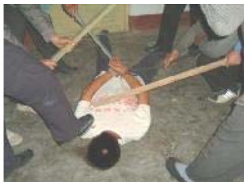
上图 酷刑演示: 暴打