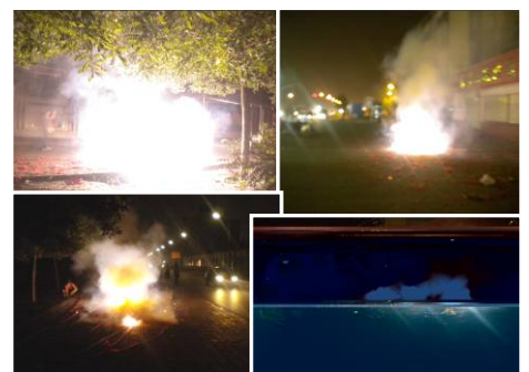
廊坊市夜晚街头正在燃放的“崩江”鞭炮。

红尘恶梦醒，世间烂鬼消。 摇摇红墙倒，三退潮更高。 声声扬正气，熠熠光正道。 今日喜相庆，未来更美好！