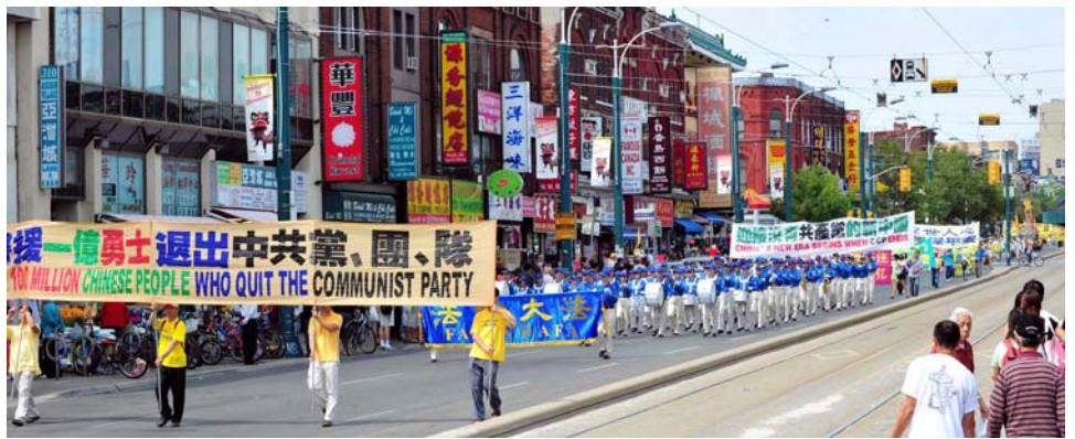
图：八月十三日，加拿大多伦多各界声援一亿中国人退出中共及其附属组织。

为什么会这样呢？因为法轮功是佛法修炼，超越了世间的任何政治、名利，中共“搞政治”的大帽子对法轮功是不灵的。历史上迫害正信的从来没有成功过。古罗马帝国皇帝火烧罗马城，嫁祸、迫害基督徒，却为自己招来了灭国惨祸。中共导演“天安门自焚”、“杀人”等闹剧诬蔑法轮功、迫害修炼人，其实是在为