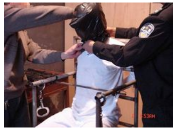
酷刑演示：用塑料袋套头，使人窒息