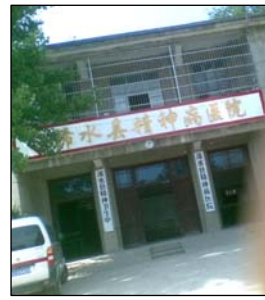
图:浠水县精神病院 左图:酷刑演示:打 毒针(注射不明药物)

中共江氏集团采用流氓手段疯狂迫害法轮功以后,我三次被投入县精神病院。第一次,医生用镇静剂把我催眠,然后给我打点滴,使我昏死过去几天。醒来后又将我绑在床上,用电针电我,问我还炼不炼,我说炼,就不停地电我。第二次是 2002 年 10 月 26 日,检察院、政保科、610 以“十六大要召开”为由,将我从劳教所强行抬入县精神病院,绑在病床上,注