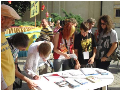
图：波兰民众纷纷签名反对中共残酷迫害法轮功。

【明慧网】二零一一年八月二十八日是波兰华沙市多元文化节，下午一点钟，在市中心银行广场到老城之间站满了观众。在锣鼓喧天的花车大游行队伍中，法轮大法学员的彩船象一幅超凡脱俗的立体画静静展现在观众面前，与热闹喧哗形成鲜明对比，令人耳目一新。慈悲祥和的《普度》、《济世》音乐，优雅平静的法轮功功法动作，吸引华沙市民和各家媒体纷纷举起手中的相机和录像机，更有观众