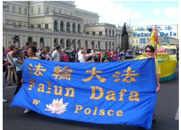
图：法轮功学员参加华沙多元文化节大游行。

子上有反对迫害法轮功的征签表，不等介绍就开始主动签名，等待签名的人群甚至排队长达十几米远。有几位未带身份证的市民，打电话要家中亲人帮忙查找个人社会号，一定要签名，一定要为法轮功无辜承受的残酷迫害表达自己的立场。