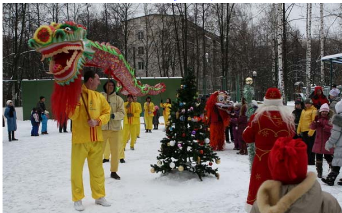
法轮功学员表演的舞龙舞狮受到莫斯科民众欢

【明慧网二零一一年十二月三十日】二零一一年十二月二十三日、二十四日，法轮功学员应邀参加了莫斯科特警培训中心的庆祝活动。