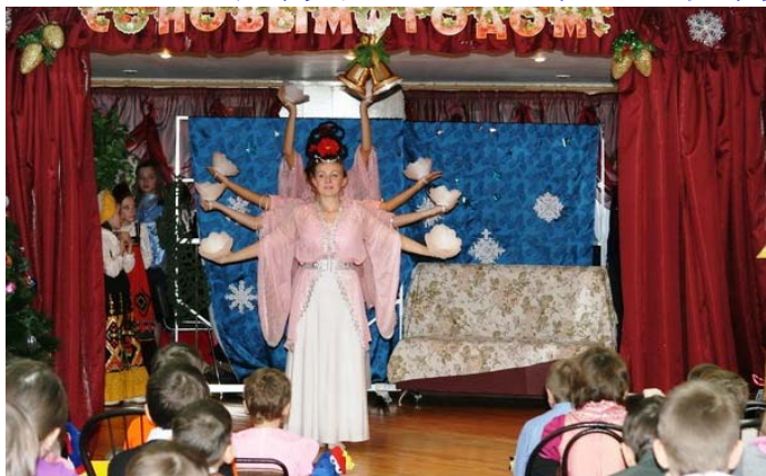
法轮功学员表演舞蹈“升起的白莲”