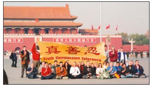
图:2001年11月,12个国家的36名西人法轮功学员到天安门告诉中国民众真相。