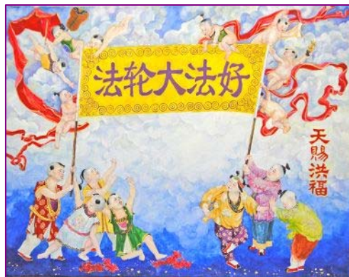
水粉画：法轮大法好

行不义必自毙,天灭中共在即。到目前为止中国大陆民众退出中共党、团、队邪恶组织的人数已超过一亿八百万,在抛弃中共、选择美好未来的今天,追随中共邪党作恶的人真得为自己和家人好好三思,是跟随邪恶做其陪葬,还是弃恶从善,未来结果就在今天的选择中。