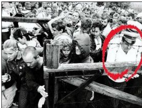
图：匈牙利警察阿帕达·贝拉（右一）