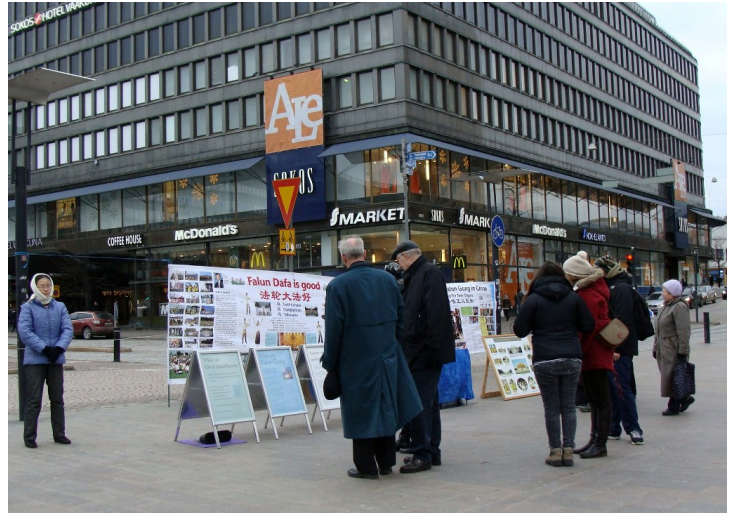
图：赫尔辛基市中心，人们在认真了解法轮功真相

一群中国学生路过，看到横幅上的图片有点吃惊。学员给他们讲天安门自焚伪案真相，那是中共一手导演来栽赃陷害法轮功的丑剧。学员们还告诉他们十二年来种种迫害的残酷，中国学生们纷纷接过真相资料，表示愿意了解。◇