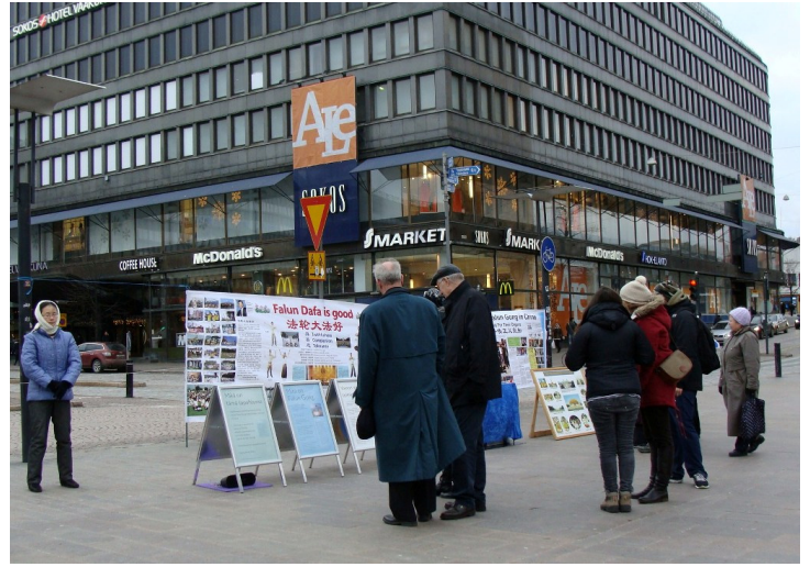
图：赫尔辛基市中心，人们在认真了解法轮功真相

一群中国学生路过，看到横幅上的图片有点吃惊。学员给他们讲天安门自焚伪案真相，那是中共一手导演来栽赃陷害法轮功的丑剧。学员们还告诉他们十二年来种种迫害的残酷，中国学生们纷纷接过真相资料，表示愿意了解。◇