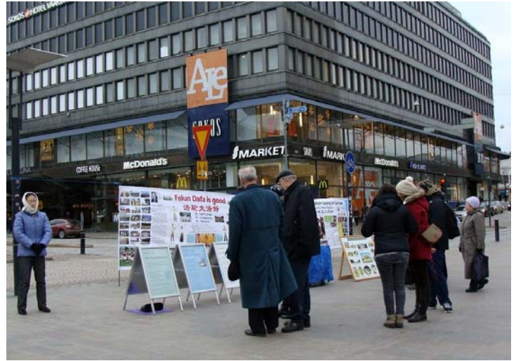
图：赫尔辛基市中心，人们在认真了解法轮功真相

一群中国学生路过，看到横幅上的图片有点吃惊。学员给他们讲天安门自焚伪案真相，那是中共一手导演来栽赃陷害法轮功的丑剧。学员们还告诉他们十二年来种种迫害的残酷，中国学生们纷纷接过真相资料，表示愿意了解。◇