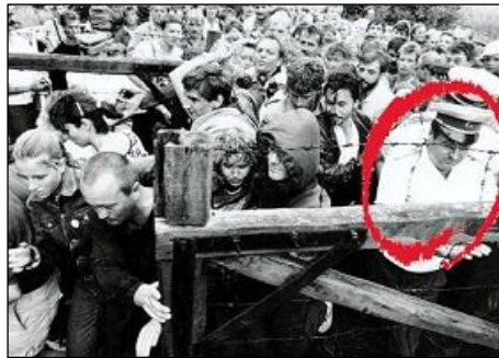
图：匈牙利警察阿帕达·贝拉（右一）