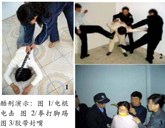
酷刑演示：图 1/电棍电击 图 2/拳打脚踢 图 3/胶带封嘴

同时我们要告诉所有被邪党谎言蒙骗参与迫害大法弟子的人：迫害好人，尤其是迫害修佛的好人是犯大罪。善恶有报是天理，无论你干了好事还是干了坏事，老天爷看的清清楚楚，而且福祸均连带家人和子孙。不要因为眼前的蝇头小利而造成你生命永远的痛悔。