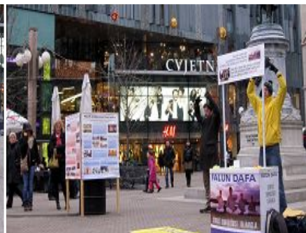
图: 法轮功学员在市中心广场讲真相, 反迫害