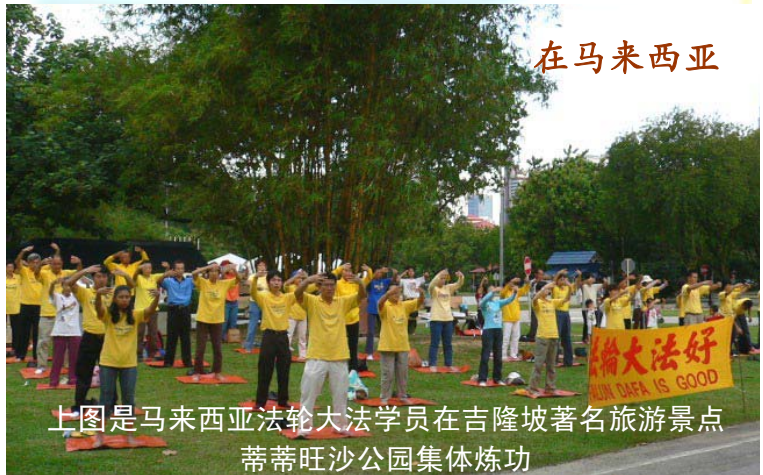
上图是马来西亚法轮大法学员在吉隆坡著名旅游景点蒂蒂旺沙公园集体炼功

在法轮功传世 19 年之后, 特别是在法轮功经历了中共恶党 12 年的疯狂迫害之后, 世人惊奇的发现——法轮功不仅没有倒下, 反而迅速传遍全球。对于经历过中共无数次政治运动的中国人来讲, 这是一个值得深思的奇特现实。