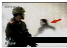
4、击打者仍保持用力姿势

进东却仍坐地轻松自如。警察本来是不背着灭火器巡逻的，所谓“自焚”当天，警察几分钟内从两辆警车里拿出二十多个灭火器和灭火毯应付“自