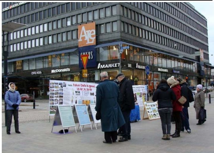
图：赫尔辛基市中心，人们在认真了解法轮功真相

一群中国学生路过，看到横幅上的图片有点吃惊。学员给他们讲天安门自焚伪案真相，那是中共一手导演来栽赃陷害法轮功的丑剧。学员们还告诉他们十二年来种种迫害的残酷，中国学生们纷纷接过真相资料，表示愿意了解。◇