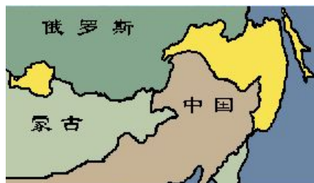
至少达100多万平方公里被侵占的中国领土被江泽民正式划入俄罗斯

1999年12月9~10日，江泽民同俄罗斯总统叶利钦签订了丧权辱国的《中华人民共和国政府和俄罗斯联邦政府关于中俄国界线东西两段的叙述议定书》。江泽民总共出卖了东北地区一百四十多万平方公里在历史上有争议的疆土给俄国，相当于40个台湾的面积。江泽民还将本属吉林省的图们江出海口划给俄国，封死了中国东北通往日本海的出海口。江泽民还命令已经从中俄国境线后撤的中国边防军再后撤一百公里。为掩人耳目和对付边防军人的不满，江泽