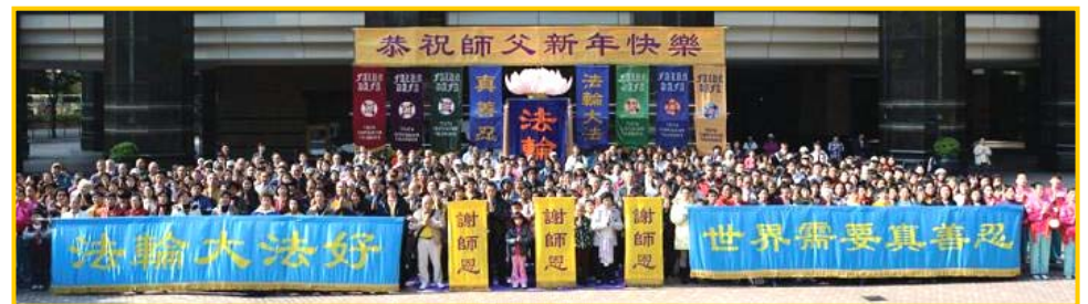
图：中国是法轮大法的发源地，但又是全世界唯一不让炼法轮功的国家。在同属中国的香港，都可以自由修炼法轮功。图为香港法轮功学员 2012 年新年感师恩。