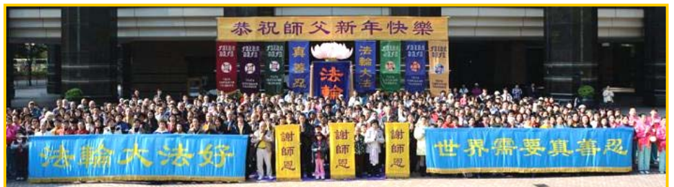
图：中国是法轮大法的发源地，但又是全世界唯一不让炼法轮功的国家。在同属中国的香港，都可以自由修炼法轮功。图为香港法轮功学员 2012 年新年感师恩。