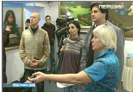
图：乌克兰电视一台报道真善忍美展

乌克兰国家电视一台于一月十日晚间新闻的报道中说，上个世纪末，法轮大法以其崇高的内涵，在全球迅速弘扬。然而当信仰法轮大法的