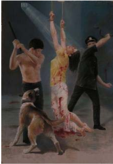
■酷刑演示：悬空抽打