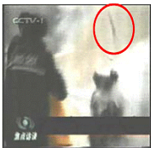
4、击打者仍保持用力姿势