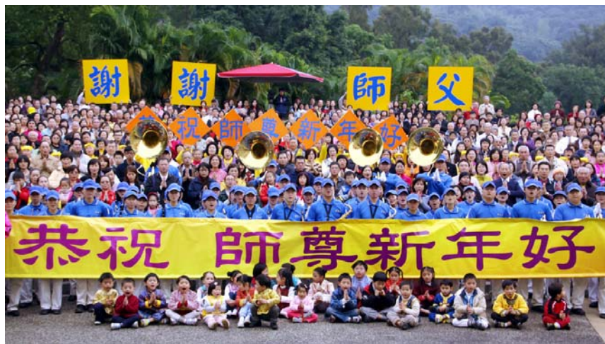
二零一二年一月十五日，上千台北法轮功学员齐聚士林官邸，在官邸内的露天音乐台向慈悲伟大的师尊恭祝新年好

游客们走进士林官邸，迎面而来的是“法轮大法好”横幅及法轮功学员热情的招呼，悠扬的乐音也吸引旅客们不由自主地目光投向炼功场面。有一块展板前吸引很多人驻足观看。一位男士喊着他的同伴，手指着斗大的“国际逮捕令”这展板说：“快过来看啊，这些人（迫害元凶江泽民等）被告了。”这是台湾法轮功学员反迫害十二年来在旅游景点讲清真相的一个缩影。