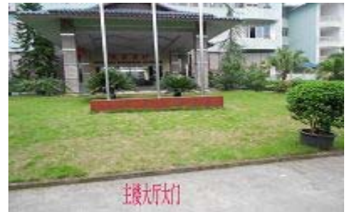
重庆市九龙坡区洗脑班