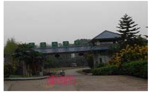
重庆市九龙坡区洗脑班