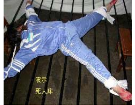
酷刑演示：死人床（呈“大”字型绑在抻床上）

在桦川县医院，恶警折磨她，没有尿时，强迫她上厕所，有尿时不让她上厕所，实在忍不住了就尿在裤子里，整个人浸泡在湿湿的裤子里，可想而知，在这过程中，这种非人的折磨让她承受了多大的痛苦。