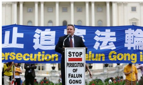
图：今年七月十二日，数千名法轮功学员在华盛顿国会山前举行制止中共迫害法轮功集会，美国众议院人权委员会主席克里斯·史密斯议员到场声援发表演讲谴责中共活摘器官罪行。

2006 年起，加拿大著名人权律师大卫·麦塔斯和加拿大前亚太司司长、皇家检察官大卫·乔高，完成了一份“中共活体摘取法轮功学员器官”的调查报告，后在联合国公布。该调查报告现已被编辑成《血腥的活摘器官》一书出版，并被翻译成 18 种语言。书中提供 52 种证据足以证实此罪行。那些大陆医生甚至在咨询电话中直言不讳地承认，器官供体是年轻健康的法轮功学员。2012 年 7 月，另一本揭露中共活体摘取法轮功学员器官暴行的新书《国有器官》出版发行。《国有器官》一书汇集了 12 名来自四大洲、七个国家的专家的文章，包括 5 名医生，1 名医药伦理学家。他们从不同角度剖析了在中国发生的非法器官移植和活体摘取法轮功学员器官的暴行。◇