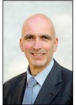
图：瑞士日内瓦州大议会人权委员会主席马克·费尔奎特

瑞士日内瓦州大议会人权委员会主席马克·费尔奎特先生特别发表声明，谴责在中国发生的大规模有组织的强行摘取人体器官的罪行，并呼吁有良知的中国官员行动起来，公开谴责这些令人发指的犯罪行为，尽快终止这一犯罪。◇