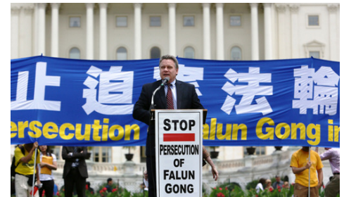
图：今年七月十二日，数千名法轮功学员在华盛顿国会山前举行制止中共迫害法轮功集会，美国众议院人权委员会主席克里斯·史密斯议员到场声援发表演讲谴责中共活摘器官罪行。

这份由国会议员罗伯特·安德鲁斯和克里斯·史密斯发起的信件指出：在美国国会做证的证人说，“中共从有信仰的人和从政治异议人士身上摘取器官”，就是说中国的医院和医生强制从犯人身摘取器官，从活着的法轮功学员身上摘取器官。信中还指出，重庆市副市长王立军逃进美国驻成都领事馆时，可能已经供出了从活着的法轮功学员身上摘取器官的恶行。议员们要求国务院公布其获得的有关发生在中国的滥用移植器官的行径，包括王立军提供给美国驻成都领事馆的文件。