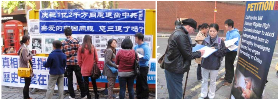
图：华人、留学生在横幅前了解真相，右图民众在揭露中共活体摘取器官罪恶展板旁，签名支持制止中共活摘法轮功学员器官的罪恶。

【明慧网】二零一二年十月六日，英国法轮功学员再次来到伦敦唐人街集会，呼吁国际社会聚焦中共活摘法轮功学员器官的反人类罪行，鼓励广大民众了解真相选择正义和良知，同时帮助中国人三退（退出中共党、团、队）。英国法轮功学员在活动现场挂满了中英文横幅和揭露中共六十多年暴政的真相图片，横幅上写着：“中共活体摘取器官天理不容”、“请帮助制止中共活摘法轮功学员器官”、“英国退出中共服务中心”、“亲爱的中国同胞，您三退了吗？”以及“庆祝一亿二千万中国同胞退出中共”。两个特制的要求联合国开展中共器官活摘罪行的征签横幅凸显了当天活动的焦点。