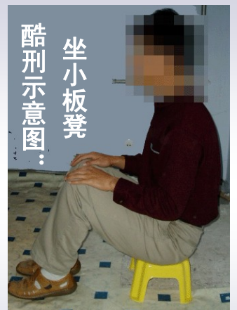
酷刑示意图：坐小板凳

下图：根据当事人描述，由法轮功学员重组当时迫害的情景。山东省第二劳教所恶警将法轮功学员的双手呈“大”字绑在一根扁担上，仰面躺在走廊里不准合眼，只要一合眼，恶人就用木棍在额头上狠敲一下。