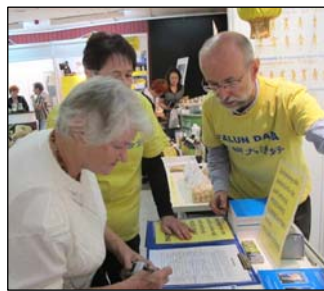
图：法轮功学员做专题报告，并展示功法。右图：波兰民众签名谴责中共迫害