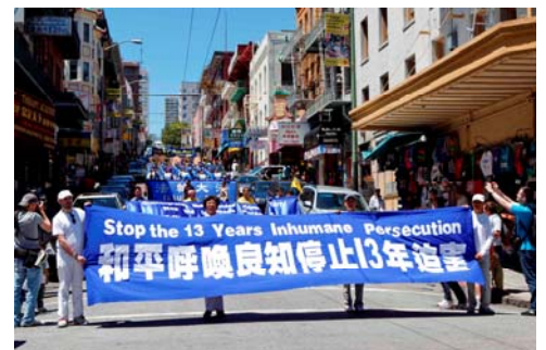
海外法轮功学员游行，呼吁停止迫害